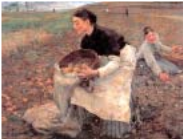
«На уборке картофеля».

того, сообщается, что «в дореволюционное время преобладала посадка картофеля, который продавался на винокуренных заводах». Причем, что примечательно, культура возделывания картофеля была передовой по тем временам. Например, в хозяйстве, которое велось в районе Кобылинского хутора, применялся «квадратно-гнездовой способ посадки», что обеспечивало стабильность урожая даже в засушливые годы.