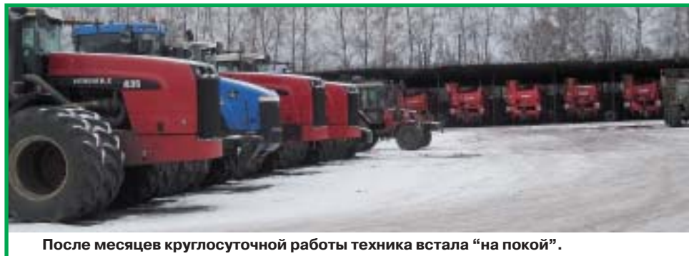
После месяцев круглосуточной работы техника встала "на покой".